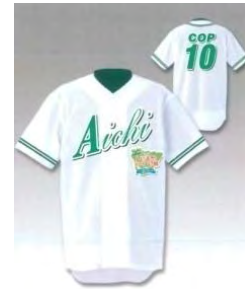
(ユニフォームイメージ)

オーガニックコットン製のオリジナルユニフォームを着用した26名の隊員が、2～4班に分かれて、平成22年10月上旬までの間に愛知県内全市町村のほか、東京都、大阪府、中部8県（富山、石川、福井、長野、岐阜、静岡、三重、滋賀）において普及啓発活動を順次展開します。