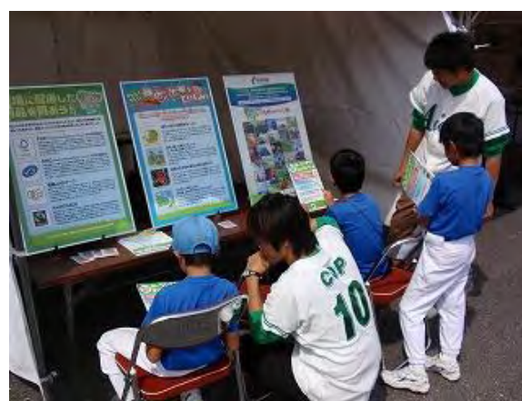
あいち いきもの・BINGO ゲーム