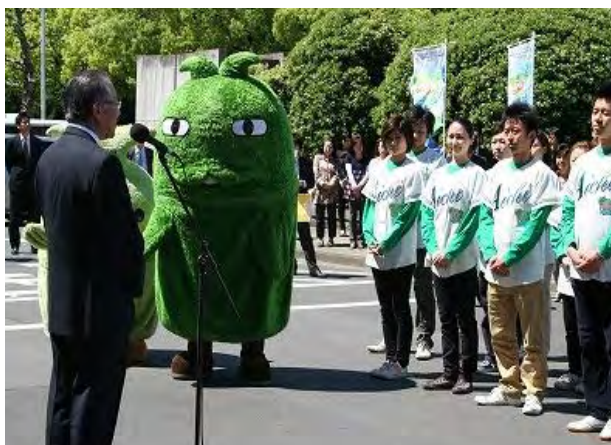
出発式（H22年5月14日、愛知県庁前）

「あいち いきものキャラバン隊」のこれまでの活動の様子を簡単に写真で紹介します。