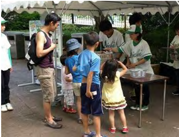
啓発グッズの配布 (東京都)