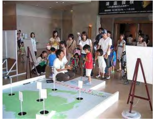
あいち いきもの・カップインゲーム② (滋賀県)