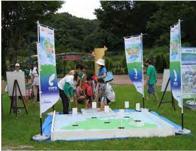
あいち いきもの・カップインゲーム① (岐阜県)