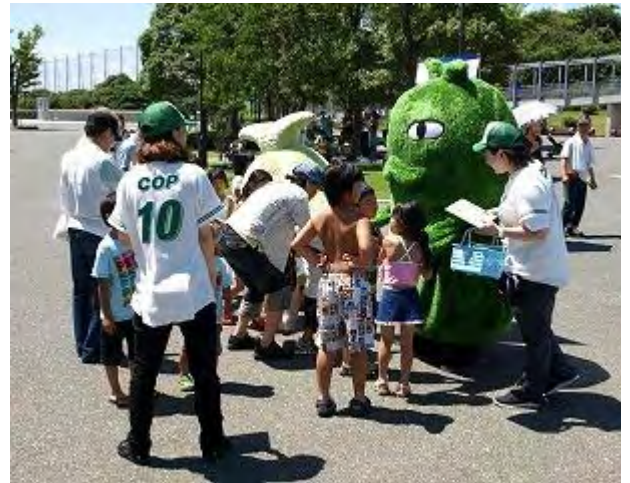
モリゾー・キッコロの登場 (静岡県)