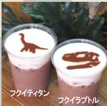
フクイティタン フクイラプトル

夏にピッタリ！冷んやり甘いアイス ココア。フクイティタン、フクイラプトル を描いたハンズカフェのラテアート。